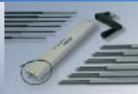
Bestandteile von easymotion easymotion components