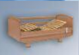
Gesundheitsbereich Medical & rehabilitation equipment