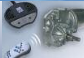
Elektromotor electric motor